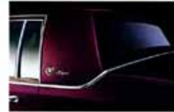
Delightful ornamentation of Brougham d'Elegance.

A delightful way to assert your individuality... Cadillac Special Editions are a further expression of your luxury of choice.