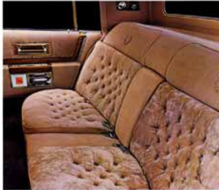
Light Beige Heather and Raphael Knits fabric in Brougham d'Elegance.