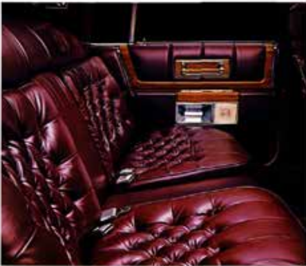
Brougham d'Elegance interior with Dark Claret leather in seating areas.

Available only for Coupe DeVille, and shown on page 8, this dramatic roof treatment combines a gleaming chrome crossover roof molding with a selection of 15 available colors of Elk Grain vinyl. A French seam surrounds the rear window to provide a look of distinction.