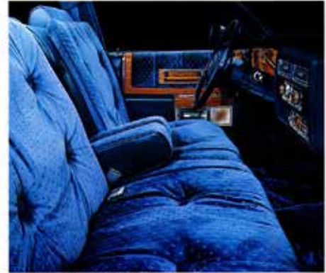
DeVilLe d'Elegance interior in Dark Blue Venetian Velvet.

145 pk. Vreemd dat de injectie minder pk had, maar het was een vrij primitief Single point Fuel Injection systeem in tegenstelling tot de voorganger die acht injectoren had. De Seville kreeg de 5,7 liter V-8 diesel met 105 pk als standaard motor die in 1978 door Oldsmobile was ontwikkeld. De diesel was afgeleid van de befaamde en betrouwbare Rocket motor. Op alle andere modellen was de diesel als optie verkrijgbaar. Een Seville met de benzine motor was $ 266 goedkoper dan de diesel. Later in 1980 werd de 4,1 liter V-6 Buick motor met 125 pk als optie verkrijgbaar. Voor het eerst in zestig jaar was dit een andere motor dan een V-8. In 1980 werd ook de Seville geleverd met de sterkere 5,7