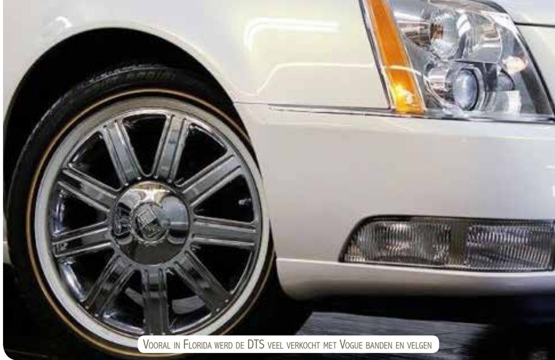
VOORAL IN FLORIDA WERD DE DTS VEEL VERKOCHT MET VOGUE BANDEN EN VELGEN