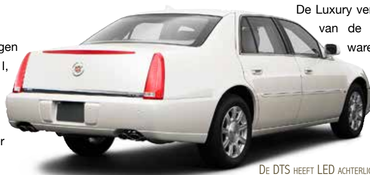
DE DTS HEEFT LED ACHTERLICHTEN

Een functionaliteit is dat bij een botsing via de satelliet de positie van de auto wordt doorgegeven aan de alarmcentrale zodat er