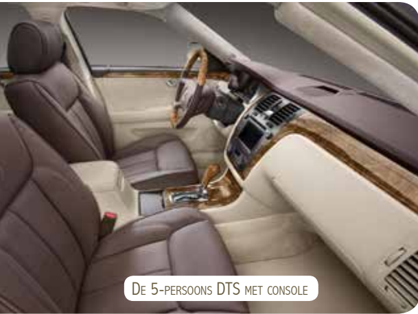
DE 5-PERSOONS DTS MET CONSOLE