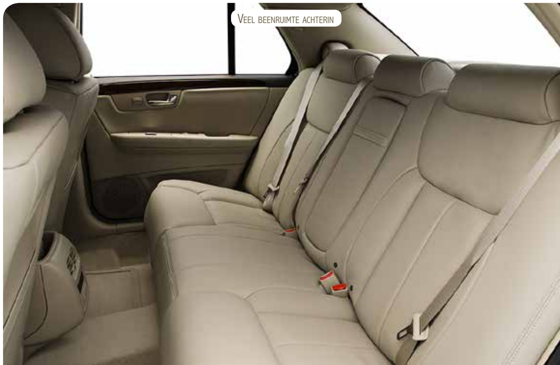
VEEL BEENRUIMTE ACHTERIN