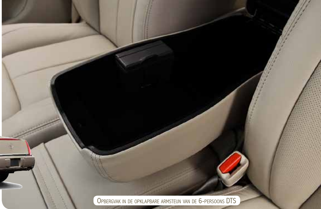
OPBERGVAK IN DE OPKLAPBARE ARMSTEUN VAN DE 6-PERSOONS DTS

De Luxury I versie had onder meer geheugens