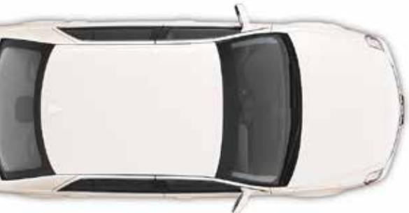
DTS-L VAN DABRYAN MET VERLENGDE ACHTERDEUREN

Six-inches wider door opening and additional legroom!