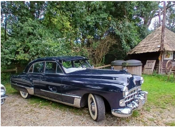
1949 SERIES 62 SEDAN VAN JAAP WUST