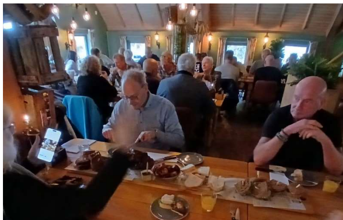
LUNCH IN DE BOERENSCHUUR IN VIERHOUTEN