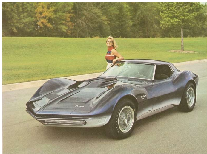
1965 CHEVROLET CORVETTE MAKO SHARK II

In het technisch vakblad van zijn vader zag hij een foto van de Macho Shark 2 die hem enorm aansprak. Hij zei toen: "Dat wordt later mijn auto".