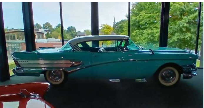
1958 BUICK SUPER