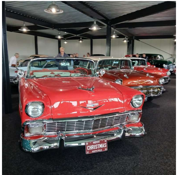
1956 CHEVROLET BEL AIR CONVERTIBLE