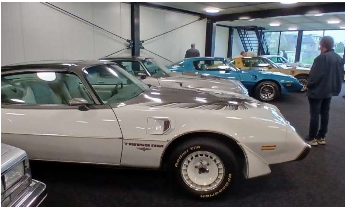
PONTIAC FIREBIRDS EN TRANS AMS