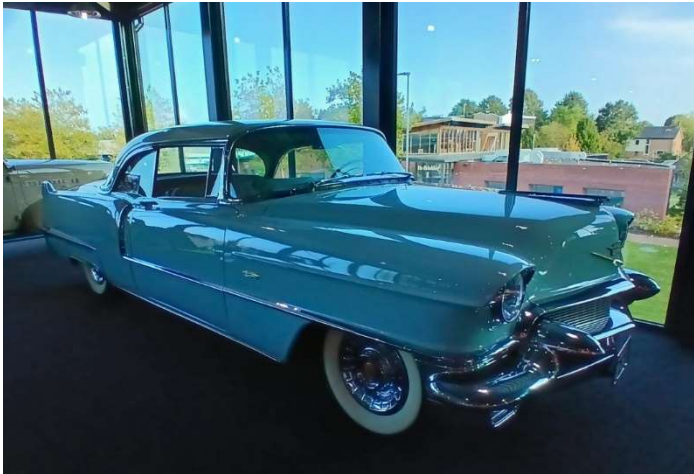
1956 COUPE DE VILLE