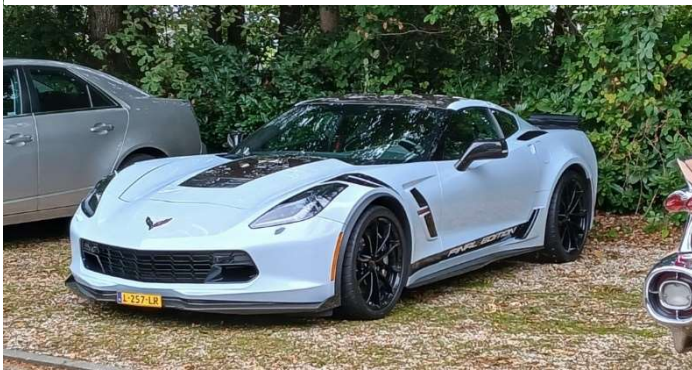
2019 CORVETTE VAN SJAAK POOT